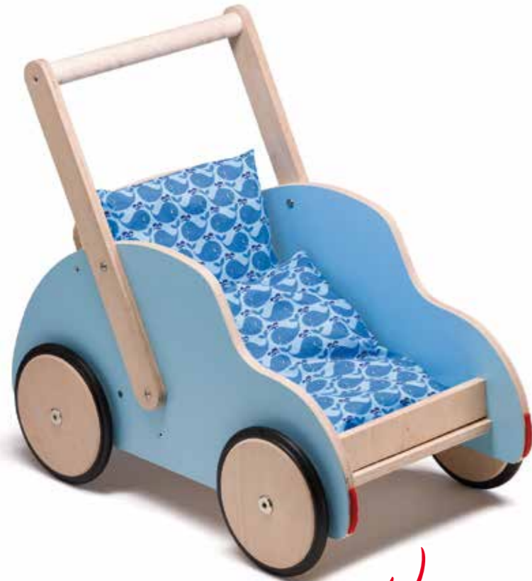
SCHIEBEWAGEN »LITTLE TONI« ... ein schöner Cruiser im Retro-Stil Birke Multiplex Außenwände farbig lackiert Griffstange in Ahorn massiv unbehandelt ca. L 52 x B 31 x H 30 cm Griffhöhe 2-stufig verstellbar ca. 47 cm hoch Best.-Nr. 6400