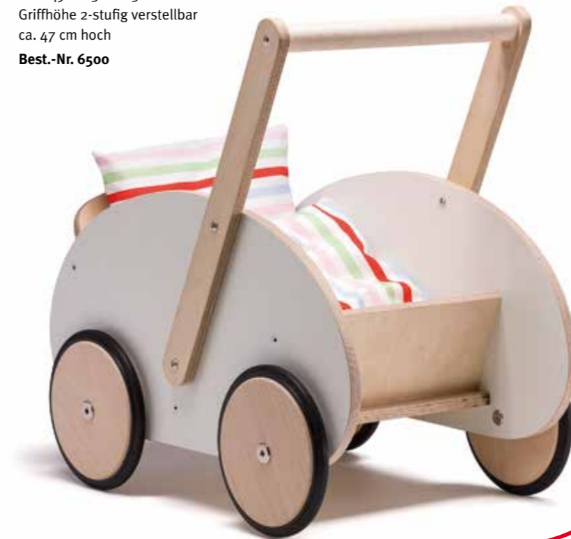
SCHIEBEWAGEN »EMILY« ... für aktive Puppenmütter, schön wie damals in den Fifties Birke Multiplex Außenwände farbig lackiert Griffstange in Ahorn massiv unbehandelt ca. L 49 x B 31 x H 30 cm Griffhöhe 2-stufig verstellbar ca. 47 cm hoch Best.-Nr. 6500