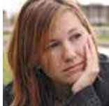
MENSCHEN MIT PSYCHISCHER ERKRANKUNG