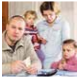
FAMILIEN MIT GERINGEM ODER MITTLEREM EINKOMMEN