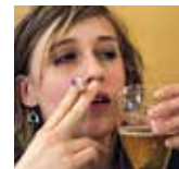
MENSCHEN MIT SUCHTERKRANKUNGEN