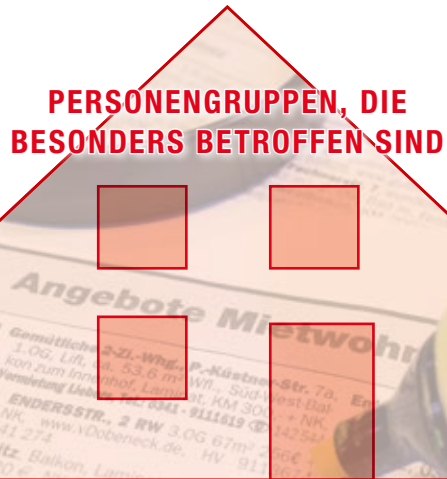
PERSONENGRUPPEN, DIE BESONDERS BETROFFEN SIND