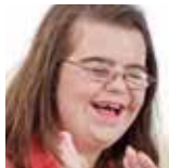
MENSCHEN MIT BEHINDERUNG