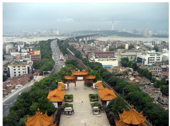
© Von ☐/Yu ☐/ Hui from Chengdu, China - Wuhan, CC BY-SA 2.0, https://commons.wikimedia.org/w/index.php?curid=2501912