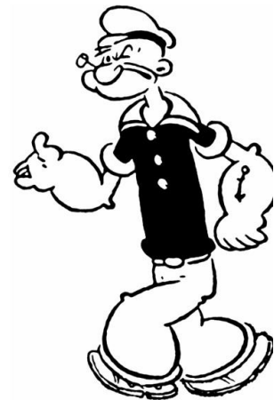
© Von Etzie Crisler Segar († 1938) - Popeye-Comicstrip vom 6. November 1936, Bild-PD-alt, https://de.wikipedia.org/w/index.php?curid=4107806