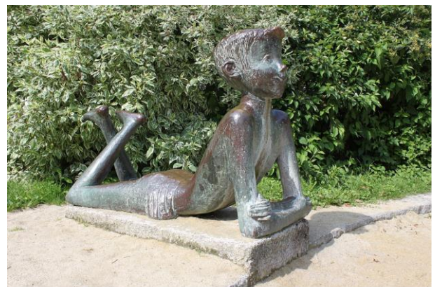
Lausbub. Bronzeplastik von Max Stockenhuber. Linz

© Von Anton-kurt - Eigenes Werk, CC BY-SA 3.0 at, https://commons.wikimedia.org/w/index.php?curid=27003328