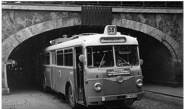
1965 in Laim, das Ende der O-Busse war nah: Das neue Unterführungssystem am Kreuzhof, das ab 1964 die Fürstenrieder Straße von der Bundesautobahn trennte, war nicht mehr für den Oberleitungsbetrieb vorgesehen. 1966 fuhren schon überwiegend neue Gelenkbusse des Typs MAN 890 UG auf der Hauptlinie 58, O-Busse nur noch als Verstärker E58 zwischen Laim und Ratzingerplatz.

J) Wer hat das berühmte Lied von der Linie 8 gesungen?