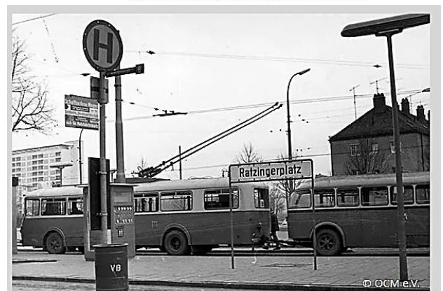
Obus-Impressionen am Ratzingerplatz kurz vor der Einstellung - noch wird jedoch mit Anhänger gefahren.

Alle weiter angeführten Linien waren weder geplant noch gebaut worden.