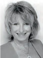
Christine Roth Ehrenamtliche Fotografin