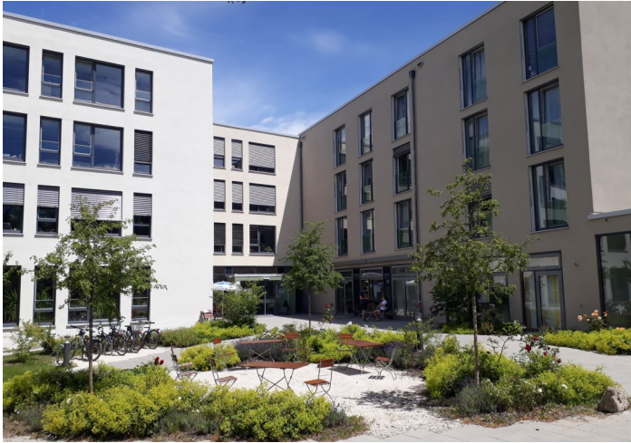
Caritas Zentrum Traunstein—Haupteingang