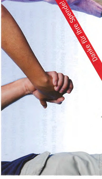
November 2016 / 1702 / ea / Änderungen und Irrtümer vorbehalten/Caritasverband der Erzdiözese München und Freising e. V.